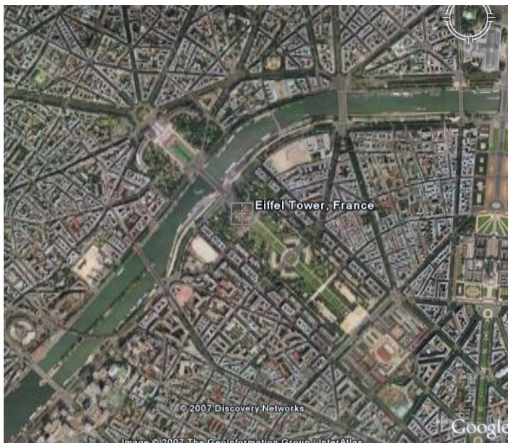
Rys. 2. Wynik wyszukiwania hasła „Eiffel Tower”