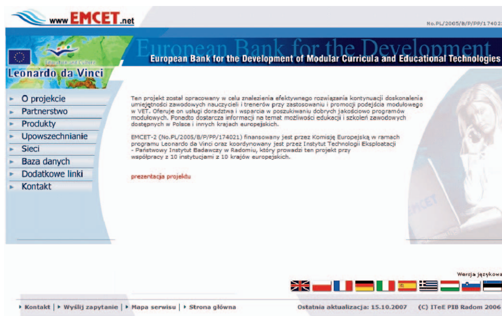
Rys. 1. Witryna internetowa projektu EMCET2 z zakładką do sieci PSKM.

w Radomiu oraz ze środków własnych instytutu. Po zakończeniu realizacji projektów członkowie PSKM wspólnie zdecydowali, w jaki sposób będzie finansowana działalność PSKM.